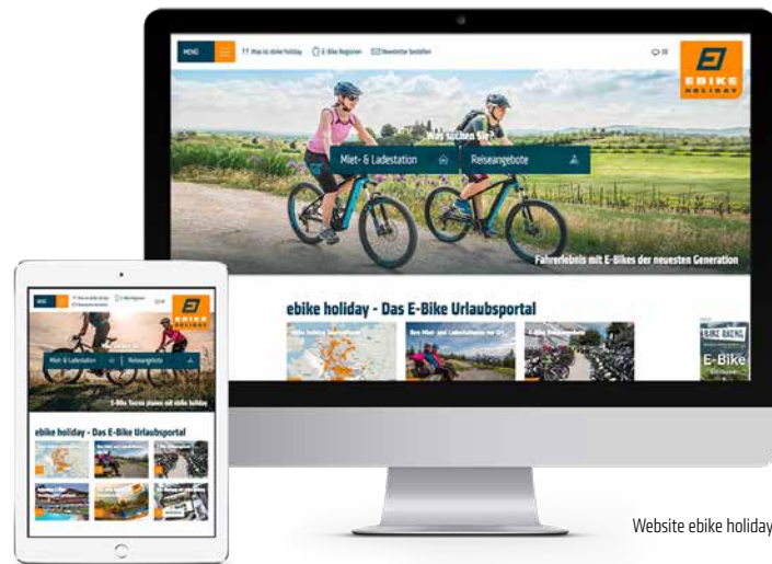
Website ebike holiday